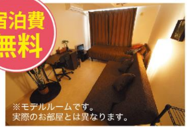
※モデルルームです。実際のお部屋とは異なります。